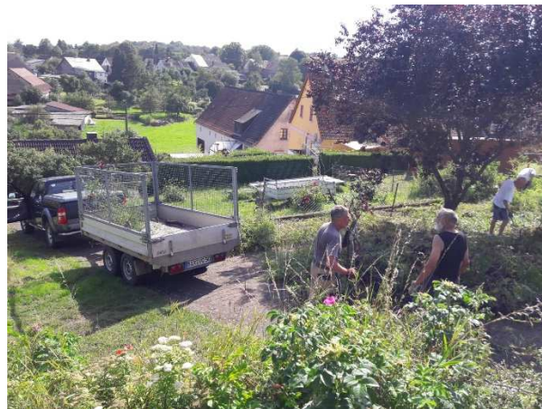
Entfernung von Gehölz im Kleegarten