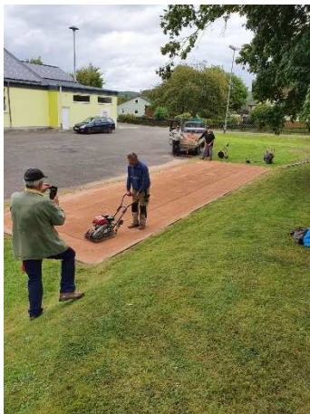
Erneuerung der Boulebahn

Die Ortsgemeinde bedankt sich ganz herzlich bei allen ehrenamtlichen Helfern der Offenen Gruppe für ihre Aktivitäten zum Wohle unserer Gemeinde.